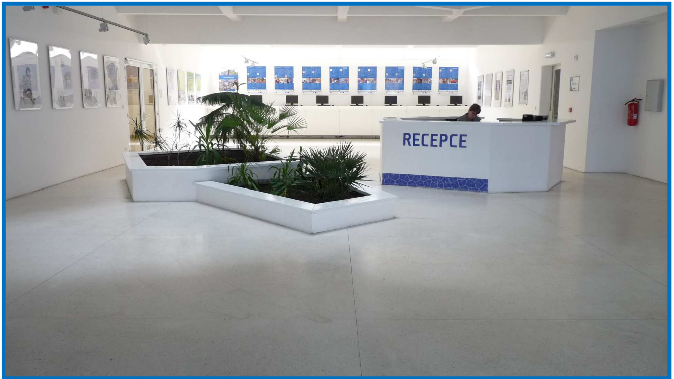
Vstupní hala ISŠTE Sokolov

Podle mezinárodních výzkumů i ČŠI existuje silná vazba mezi výsledky vzdělání a klimatem školy. Klima se dá zjednodušeně definovat jako pocit, které je na dálku cítit, který mají přímí účastníci i náhodní návštěvníci při vstupu do školy. Klima na nás dýchá. Dýchá na nás již při prvním vstupu také z prostor školy. Estetické stránky, pořádku, jeho fyzické podoby, na kterou se v projektu zaměřují.