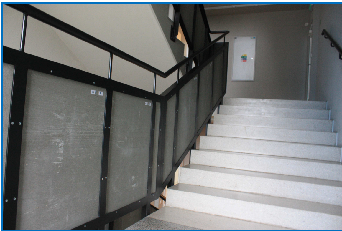
Betonové panely v prostorách schodiště školy – před a po úpravě