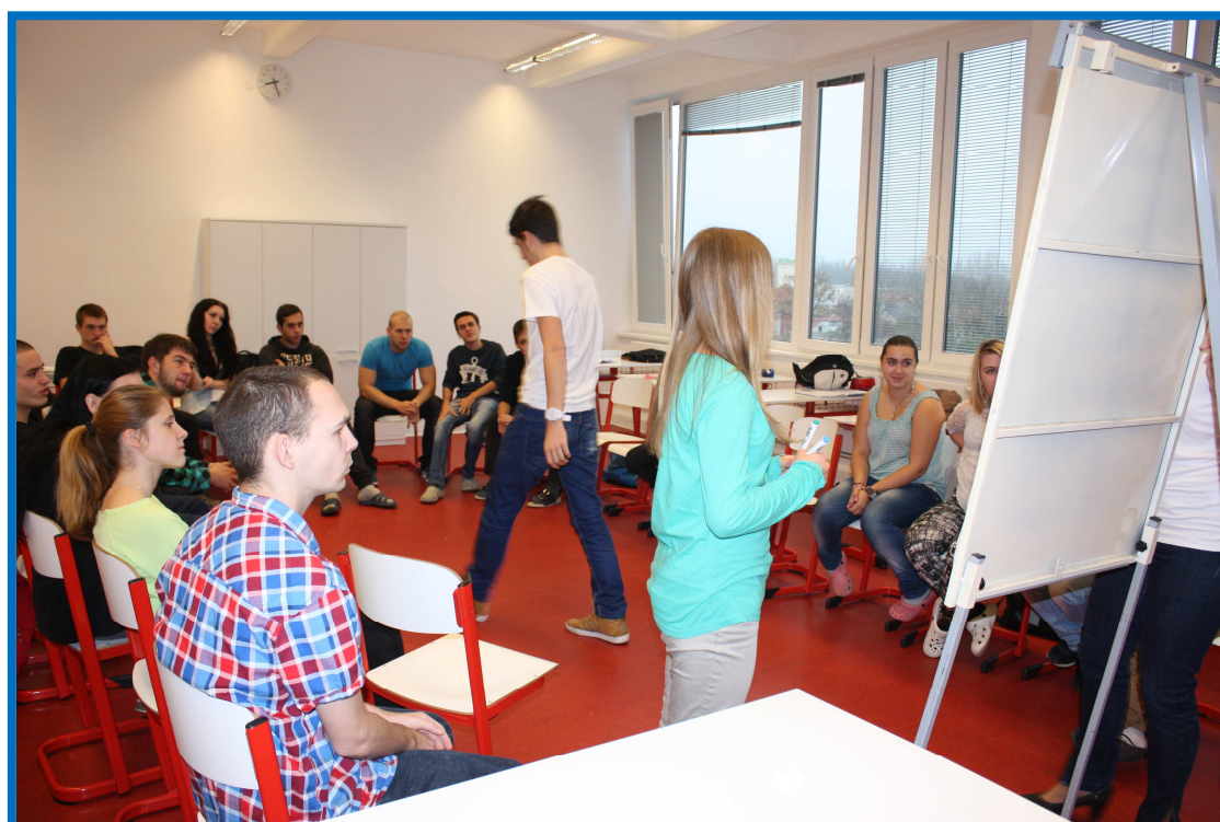
Brainstorming zúčastněných tříd